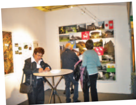
Des participants concentrés sur les questions du concours!