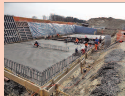
Combremont-le-Petit, réservoir de 800 m 3 , chape définitive