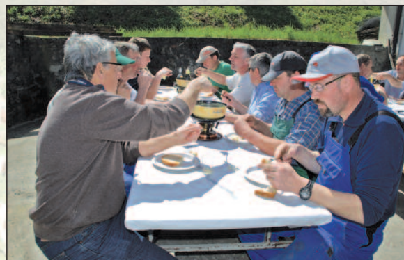
... et pour partager une fondue!