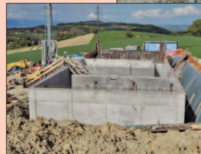
Réservoir de Combremont-le-Petit