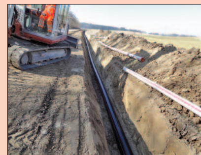
Un tronçon. L'AIEMGF en comptera pas moins de 14 kilomètres.