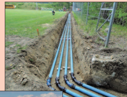
Captage de quatre sources à Chavannes-le-Chêne