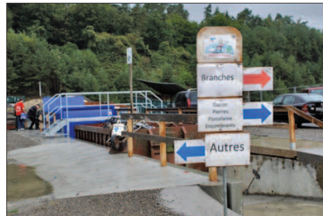
Des indications claires, de l'espace, des bennes facilement accessibles