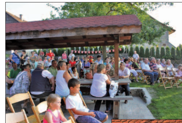
Un public nombreux et attentif aux propos de...

1 er août de Valbroye, à Combremont-le-Petit