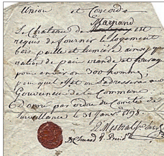
Révolution Vaudoise – ordre de réquisition du Château de Marnand du 31 janvier 1798 (Archives de Marnand CA 002)