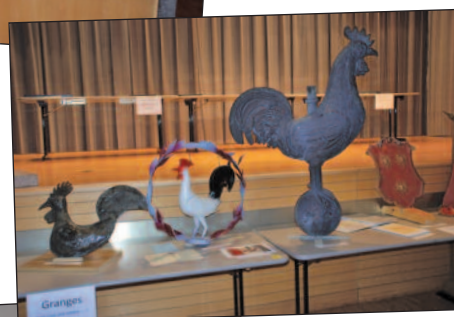
La « volière » de Granges