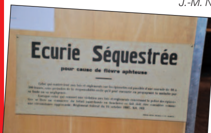
Avis de séquestre